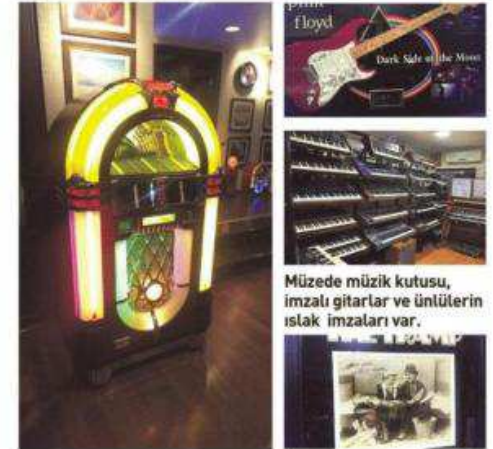
Müzede müzik kutusu, imzalı gitarlar ve ünlülerin ıslak imzaları var.