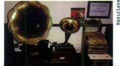
Hazırlayan: Berk İybaç