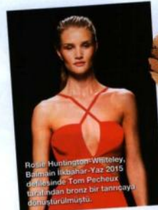
Rosie Huntington-Whiteley, Balmain ilkbahar-yaz 2015 defilesinde Tom Pecheux tarafından bronz bir tanrıçayı dönüştürülmüştü.