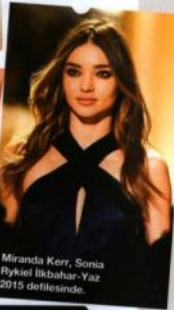
Miranda Kerr, Sonia Rykiel ilkbahar-yaz 2015 defilesinde.